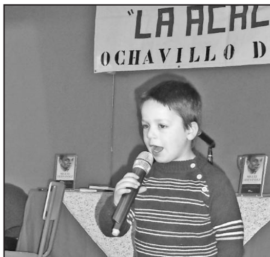
El más joven de los recitadores.