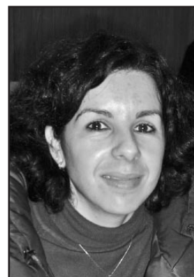
Aspirantes a la alcaldía de la Colonia de Fuente Palmera.