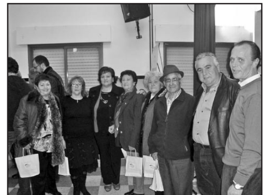
Recitadores y guitarristas.