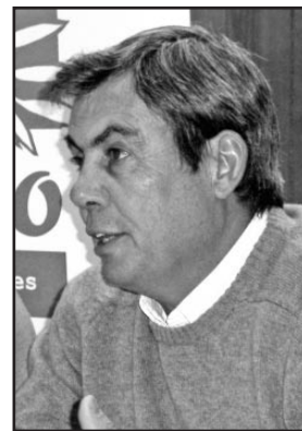
Aspirantes a las alcaldías de Ochavillo del Río y de Fuente Carreteros.

Izquierda Unida y Partido popular adelantaron hace ya tiempo sus candidaturas a encabezar las listas de las municipales.